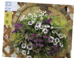
ハンギングバスケット部門