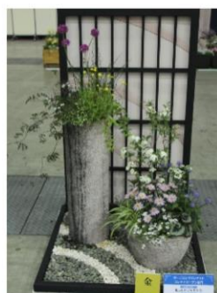
コンテナガーデン部門