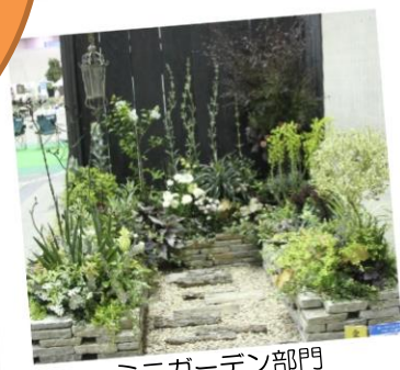
ミニガーデン部門

2015年4月開催の日本フラワー&ガーデンショウにおいて「第1回ガーデニングコンテスト」開催しましたところ、力作が多数集まり、来場者の皆さまから大変好評をいただきました。2016年は ショウ会場を横浜に移しての開催 となり、来場者増も期待されております。みなさま、ぜひふるってのご参加、お待ちしております！