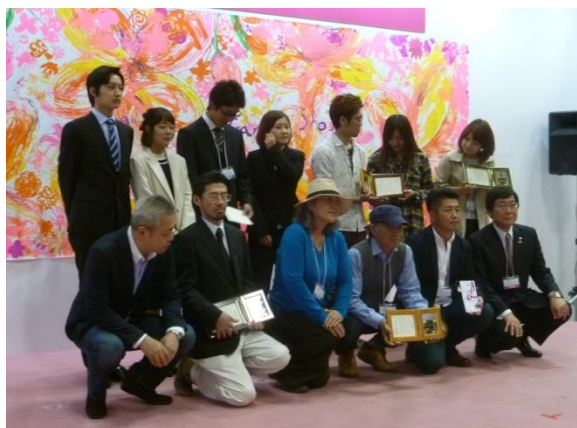
ミニガーデン部門受賞者