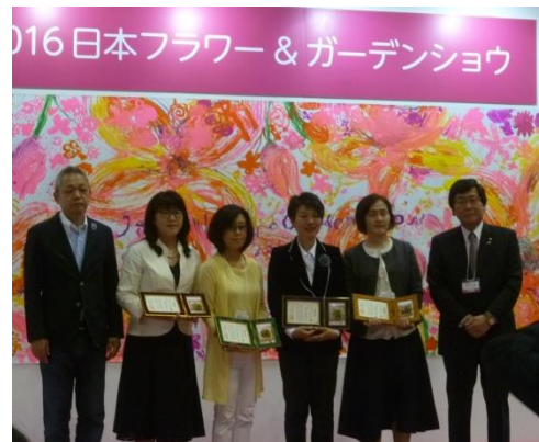
ハンギングバスケット部門受賞者