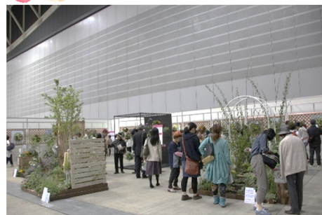
第2回コンテスト会場風景