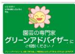
ステッカーイメージ

アクリルプレート入りの登録証 1 枚と ステッカー(A4 サイズ)2枚をお届けします。 店頭での販促にご活用ください。